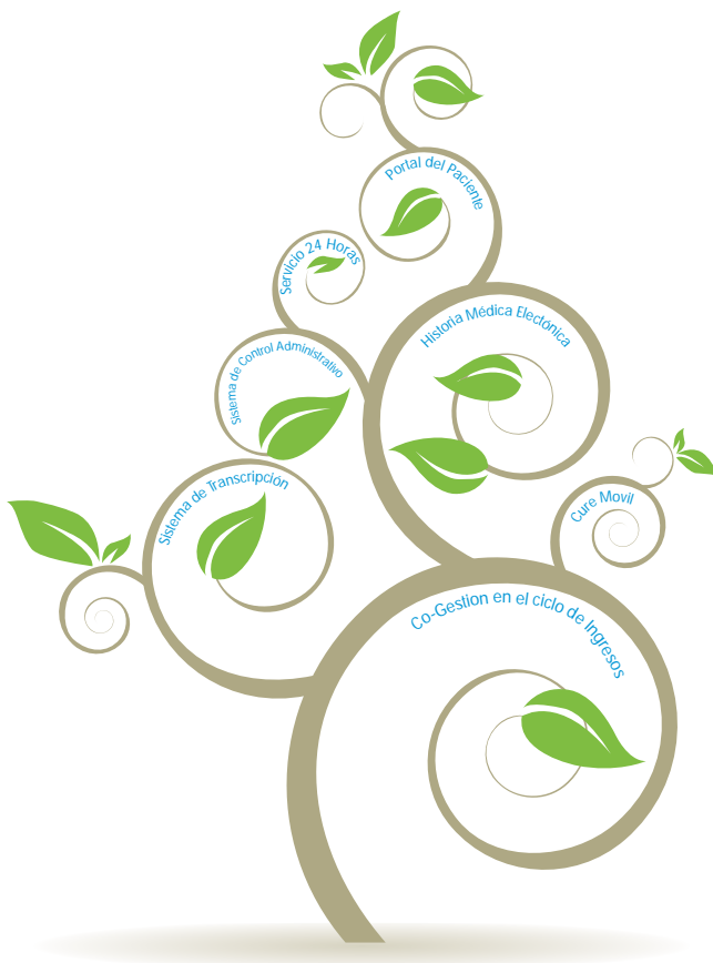
Sistema de Control Gerencial CureMD

Esta poderosa herramienta que se accesa desde Internet, cuenta con la Historia Médica Electrónica, los Portales para los Pacientes, el E-Learning, el Registro Electrónico de Órdenes, las Bases de Datos de Conocimiento Clínico, el manejo financiero de su práctica médica, el Control y Administración de los Procesos de Trabajo hasta la integración completa de los servicios de la unidad médica. Así, CureMD establece nuevos estandares de eficiencia, calidad y credibilidad.